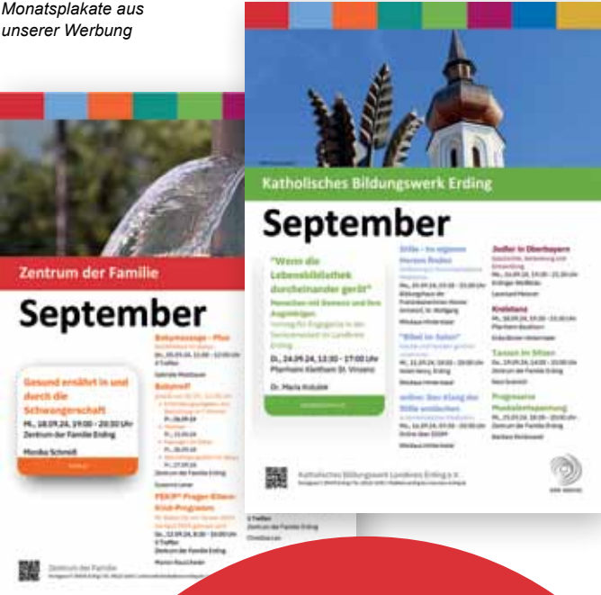
Monatsplakate aus unserer Werbung

Verpassen Sie keine Veranstaltung in KBW und ZdF! Mel-den Sie sich einfach bei unserem monatlichen Newsletter an: www.kbw-erding.de/newsletter .