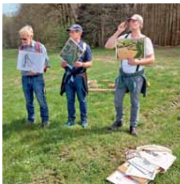
AVE – Archäologischer Verein Erding e.V.

In Kooperation mit dem Archäologischen Verein Erding e.V.